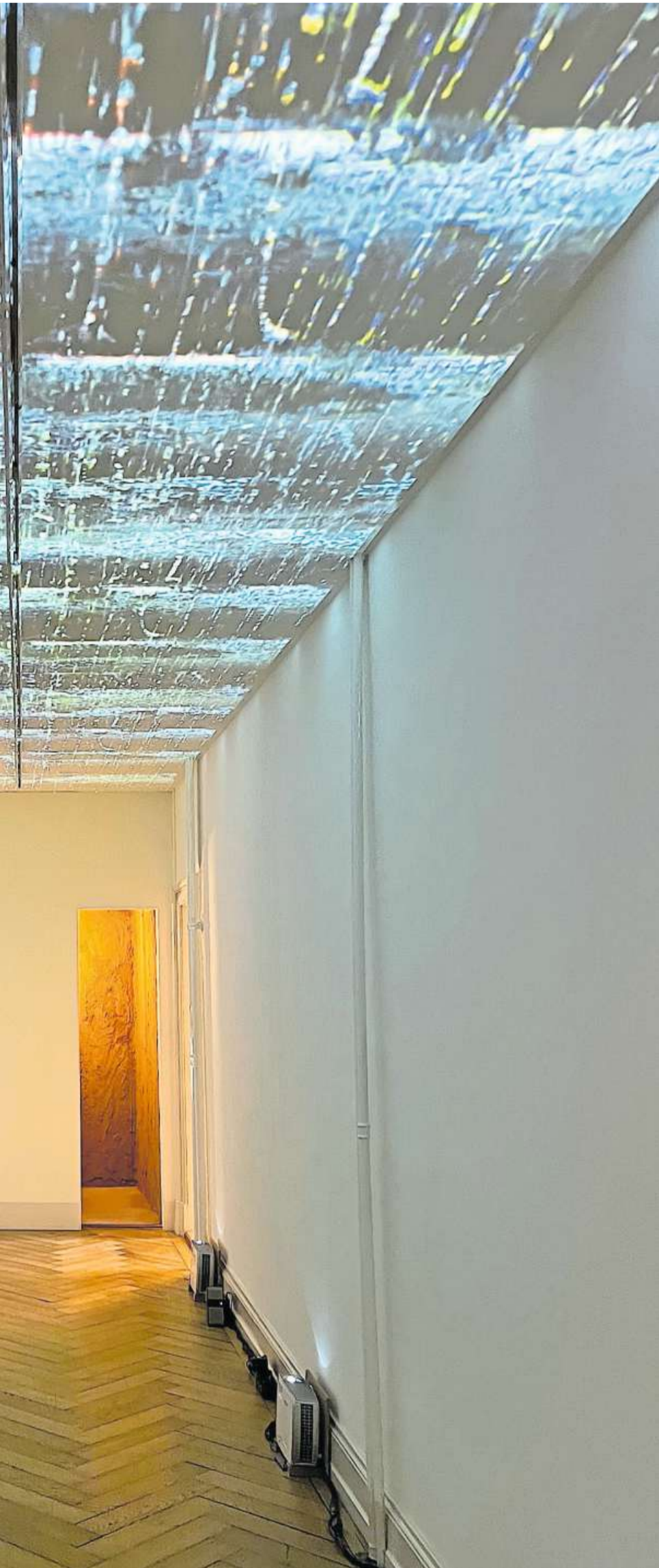
Kunsthalle Palazzo in Liestal.