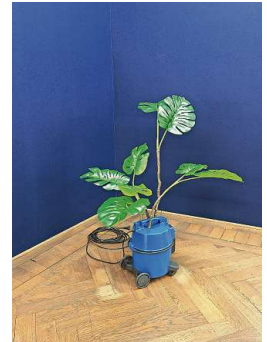
«Egg Plant». Ein Werk von Axel Gouala aus diesem Jahr.

sphäre? – wird durch eine dunkle Front überhangen, die im unteren Teil des Bildes gespiegelt wird. Dadurch entsteht ein Sog, der keine Entscheidung darüber erlaubt, ob im nächsten Moment eine Katastrophe über uns einbricht oder wir sie bereits hinter uns haben. Selbstredend ist das Bild menschenleer.