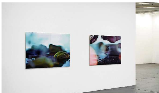
«Liquid Landscape 5» und «Liquid Planet 2». Ausstellungsansicht im Kunsthhaus Baselland mit zwei Werken von Katrin Freisager.