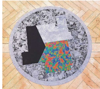
«Mimicry Domestic». Ein Werk von David Berweger aus dem Jahr 2018; Kunsthalle Palazzo.